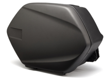
Boční brašny Touring 20 l

For all FJR1300AS accessories go to the website, or check your local dealer