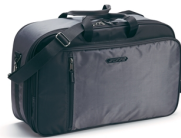
Vnitřní zavazadlo do 50l horního boxu Touring pro model FJR