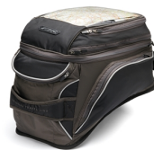
Brašna na nádrž Touring pro model FJR